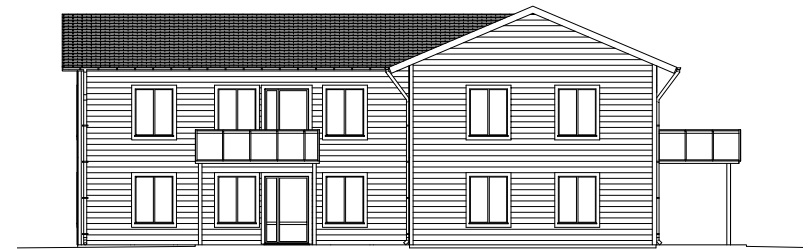
Fasad mot norr