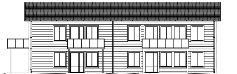
Fasad mot väster