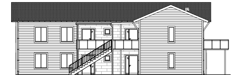
Fasad mot öster